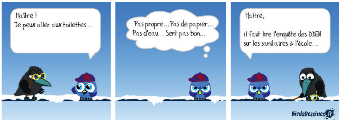
Illustrations reproduites avec l'autorisation de BirdsDessines.fr et propos tenus dans les phylactères par UD17.